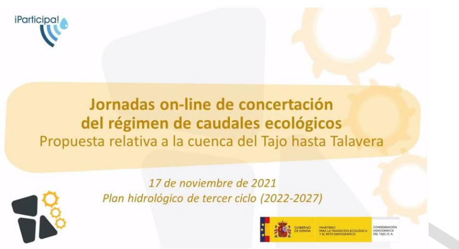
Figura 10.- Anuncio jornada de concertación del 17 de noviembre

Como todos los eventos participativos de la parte española de la Demarcación del Tajo, el taller se celebró “a distancia” mediante webinar, contó con un total de 48 asistentes en el momento de máxima conexión al taller, con un total de 62 inscritos.