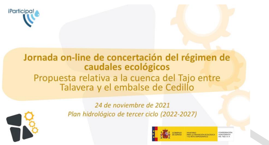
Figura 11.- Anuncio de la jornada de concertación de caudales de 24 de noviembre

Con el fin de que las reuniones de concertación fueran lo más equilibradas posible, se decidió la división de la cuenca en dos mitades “geográficas”, cuyo eje divisor sería Talavera de la Reina, y es por ello que la segunda jornada de concertación abarcaba la parte de la cuenca comprendida entre Talavera de la Reina y Cedillo. Para esta jornada, celebrada el 24 de noviembre de 2021 se contó con un total de 28 asistentes en el momento de máxima conexión al taller con un número bastante superior de inscritos.