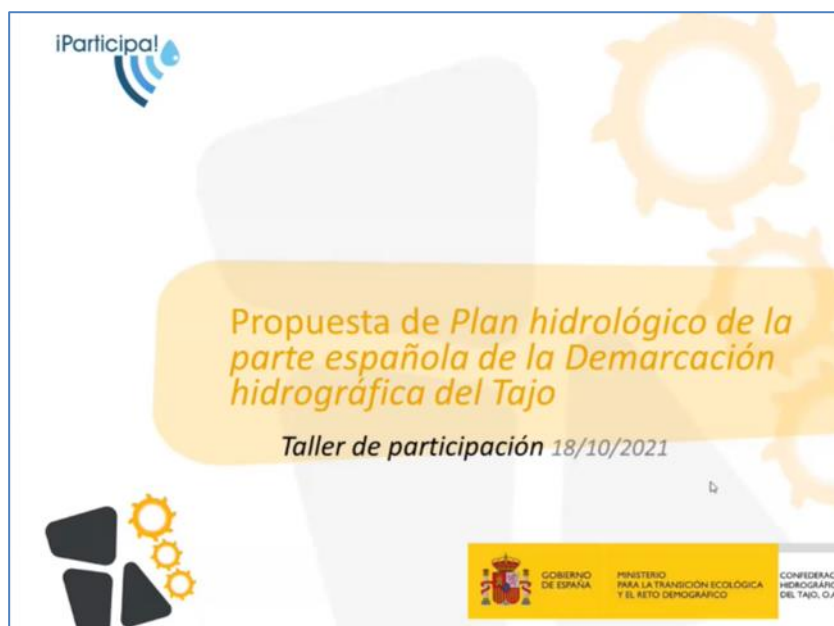
Figura 7.- Cartel de la jornada de 18 de octubre

Esta jornada, celebrada el pasado 18 de octubre de 2021 bajo modalidad “on-line” a distancia, estuvo dirigida a usuarios, grupos de interés y ciudadanía en general interesada en la gestión y planificación hidrológica de la demarcación en relación sobre los temas: Cambio Climático, Garantía en la Satisfacción de las Demandas y Explotación Sostenible de las Aguas Subterráneas