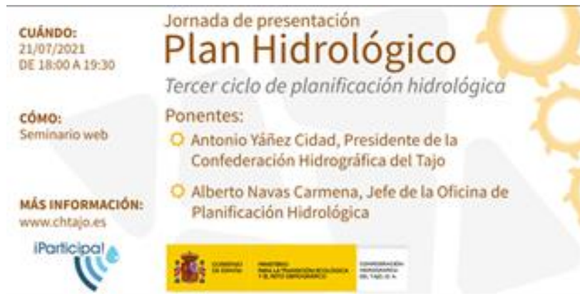
Figura 5.- Anuncio de la jornada de 21 de julio

La Confederación Hidrográfica del Tajo organizó por su parte el 21 de julio de 2021 una jornada de carácter informativo, realizada por internet, que contó con 99 inscritos y la asistencia de 60 de los mismos. Los sectores de procedencia de los asistentes fueron muy diversos, representando el conjunto los diversos intereses presentes en la Demarcación y se muestran en la figura 6.