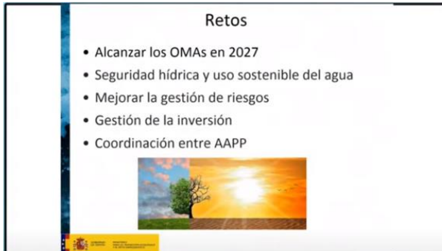
Figura 3.-Retos de la Planificación hidrológica del ciclo 2022-2027

Se proyectó seguidamente el video “Planes hidrológicos de tercer ciclo” ( https://www.youtube.com/watch?v=OI55aZNOLjE&t=99s )